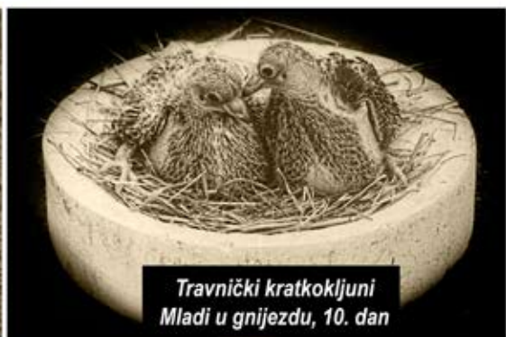
Travnički kratkokljuni Mladi u gnijezdu, 10. dan