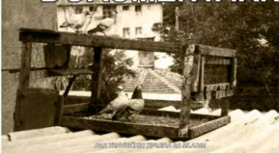
PRVA STANOVANJE DOKUMENTARNA FOTOGRAFIJA