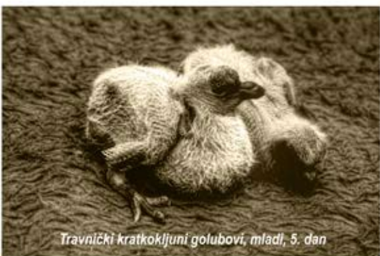
Travnički kratkokljuni golubovi, mladi, 5. dan