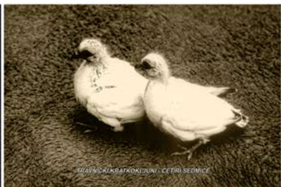
TRAVNIČKI KRATKOKLJUNI - ČETIRI SEDMICE