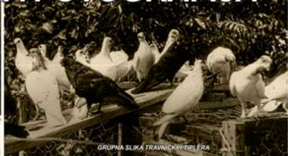
GRUPNA SLIKA TRAVNIČKI TIPLERA