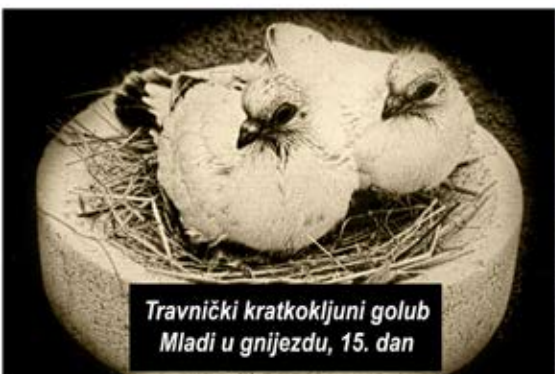
Travnički kratkokljuni golub Mladi u gnijezdu, 15. dan