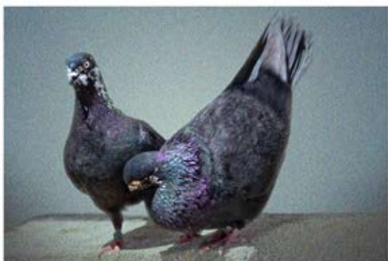
Era Mujanović (5)